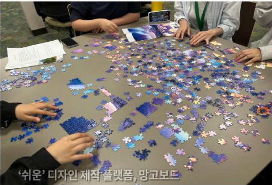
‘쉬운’ 디자인 제작 플랫폼, 망고보드

다양한 프로그램(요가, 태권도, 운동기구 등)이 있는 체육관 공부와 독서, 친구들과 함께 퍼즐을 할 수 있는 도서관 이외에도 빙고, 외부 프로그램 등을 즐길 수 있다